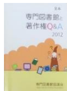
著作権Q & A